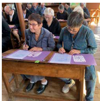
Quelques élèves très sérieuses !

Le temps fort de ce semestre a été le séjour en Auvergne où 114 participants ont passé une très bonne semaine.