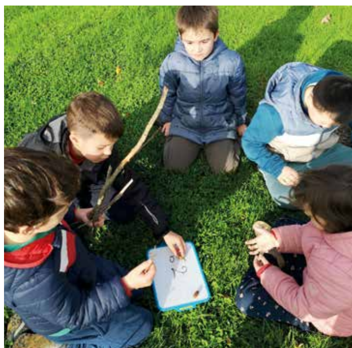
Ecole dehors à Landujan

Comme chaque année, de nombreux projets pédagogiques vont animer cette année scolaire placée sous le thème de la biodiversité : plantation de haies, classe de mer pour les GS, CP, CE1, sortie au jardin Lune/soleil pour les maternelles, excursion maritime au coeur de la réserve naturelle des Sept-Iles pour les CE2 et CM.