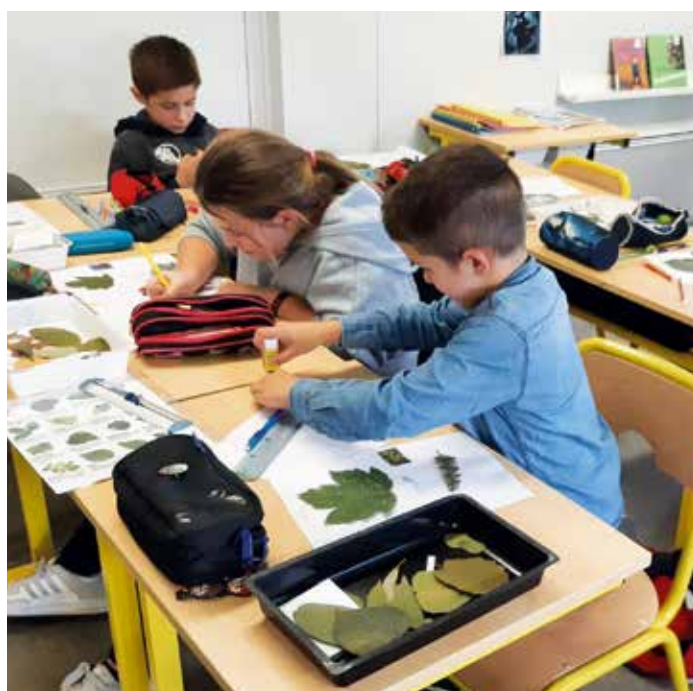
Création d'herbiers en CE1-CE2