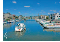
Le port de plaisance de Redon.