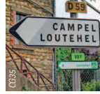
Itinéraire bien balisé.