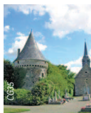
Eglise et château du Lou-du-Lac.