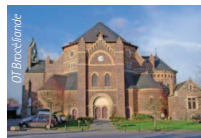
Eglise de Maxent, de style néo-byzantin.